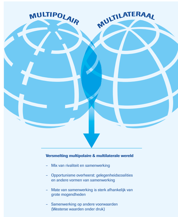
Versmelting van multilaterale en multipolaire scenario's