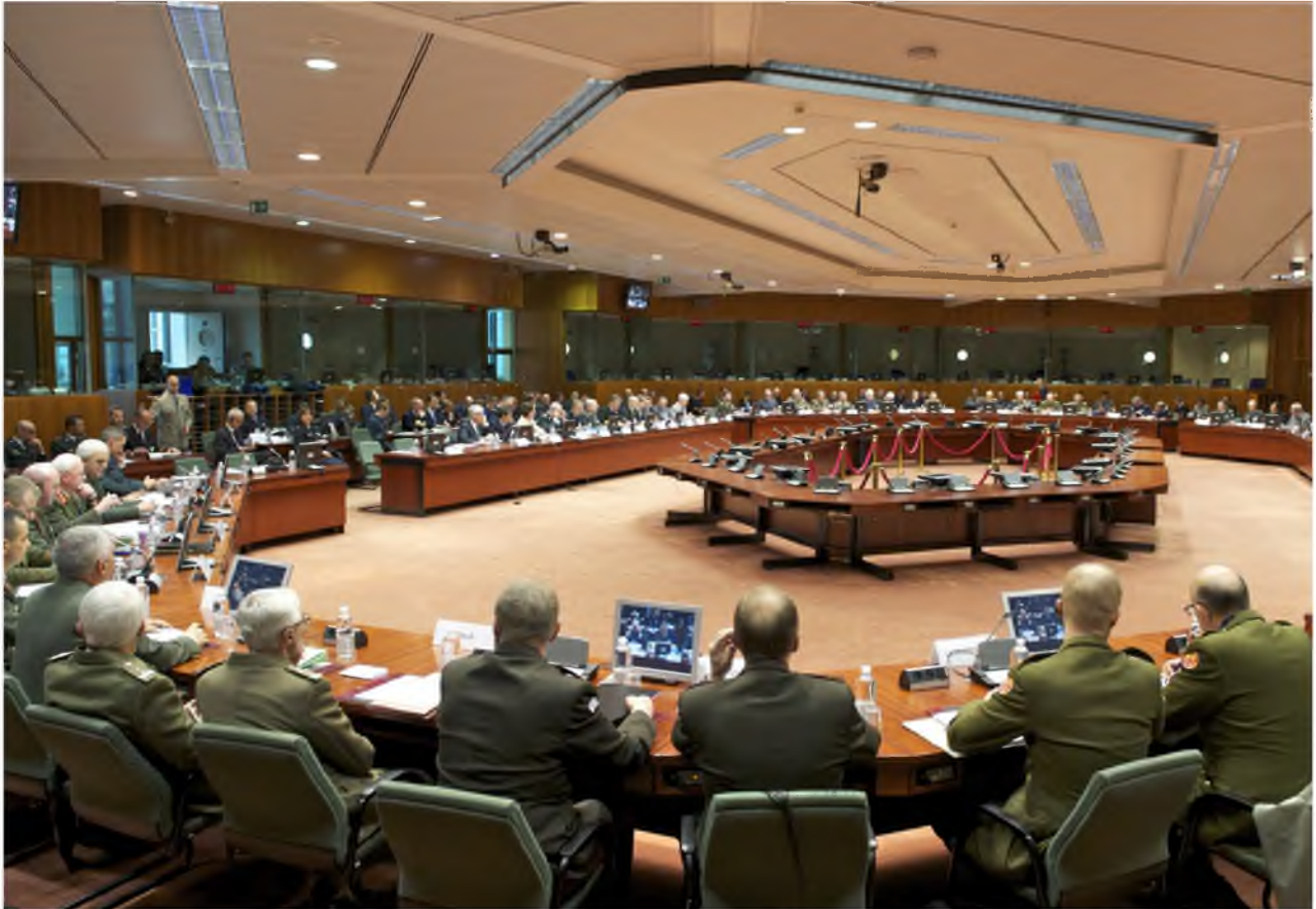
▲ De EU probeert ook inter-militair overleg te stimuleren via bijvoorbeeld het EU militair comité met de verschillende nationale commandanten der Strijdkrachten.

systeem dat uit meerdere machtscentra bestaat en waarin complexiteit en afhankelijkheid toenemen. Het spectrum aan veiligheidsdreigingen wordt daarnaast steeds breder: migratie, digitale veiligheid, gezondheid, klimaatverandering, schaarste worden onder andere als mogelijke bedreiging gezien. Hierbij wordt het onderscheid tussen 'interne' en 'externe' veiligheid steeds kleiner, omdat deze dreigingen gemakkelijk over grenzen heen gaan. Een belangrijk on-