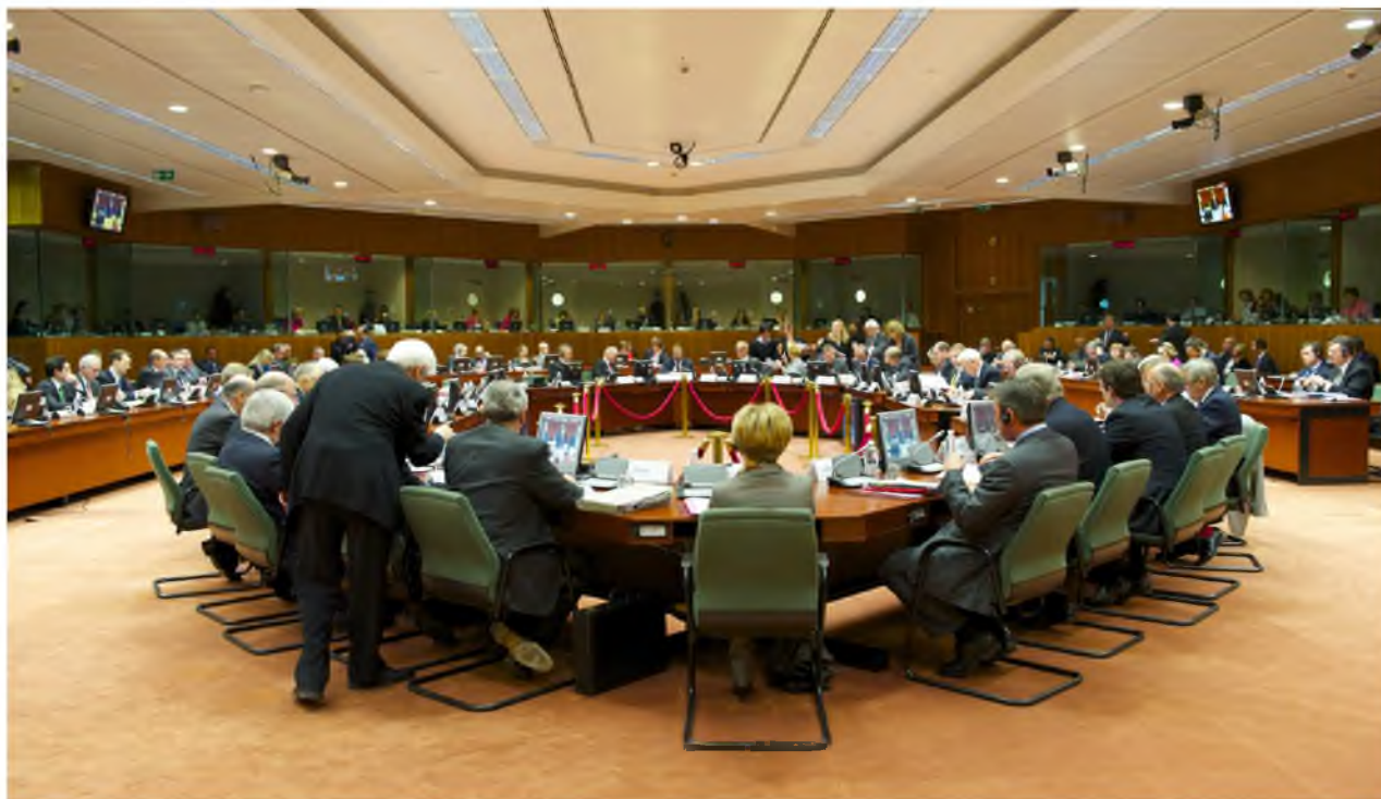
▲ Defensie blijft binnen de EU een nationale gelegenheid; zo bestaat de stuurcommissie van het EDA uit de ministers van Defensie van de verschillende lidstaten.

bovenaf opleggen en is afhankelijk van de medewerking van de lidstaten. Helaas schiet deze medewerking op het gebied van openheid en het delen van informatie tekort, en wordt er in de nationale defensieplanningen nog niet genoeg rekening gehouden met pooling & sharing . Voorbeelden van succesvolle samenwerking zijn er wel, zoals het Europees Luchttransportcommando (EATC), en er is goede hoop dat op het gebied van lucht tankers een vergelijkbaar samenwerkingsverband komt.