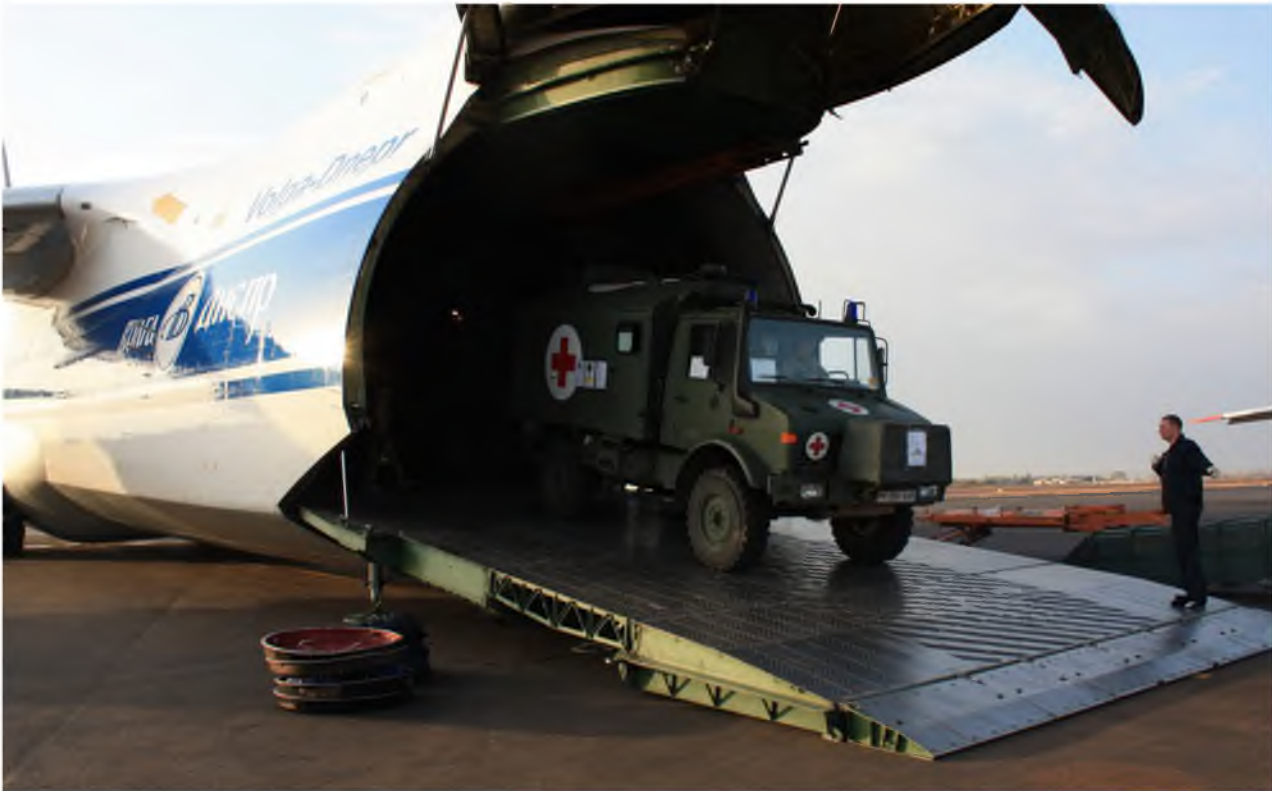
▲ De Europese Unie heeft sommige voor de haar missies essentiële zaken, zoals luchtvervoer hier voor de missie EUTM Mali, zelf onvoldoende in huis.

Op 19-20 december 2013 staat defensie voor het eerst op de agenda van de Europese Raad sinds 2008. Hierdoor is de discussie over de staat en toekomst van Europese defensie opgeleefd. In de aanloop naar de Europese Raad lag de focus op de interne defensiemarkt en onderzoek en de verbetering van de samenwerking en gezamenlijke ontwikkeling op het gebied van defensiemiddelen. Op deze punten moeten kosten worden bespaard en de Europese defensie-industrie worden gestimuleerd, om zo ondanks de bezuinigingen een militaire capaciteit te behouden. De strategische visie die aangeeft waarvoor, en wát voor defensie we nodig hebben, ontbreekt door onenigheid tussen de lidstaten. Heeft het zin om over een Europese strategie voor veiligheid en defensie te praten?