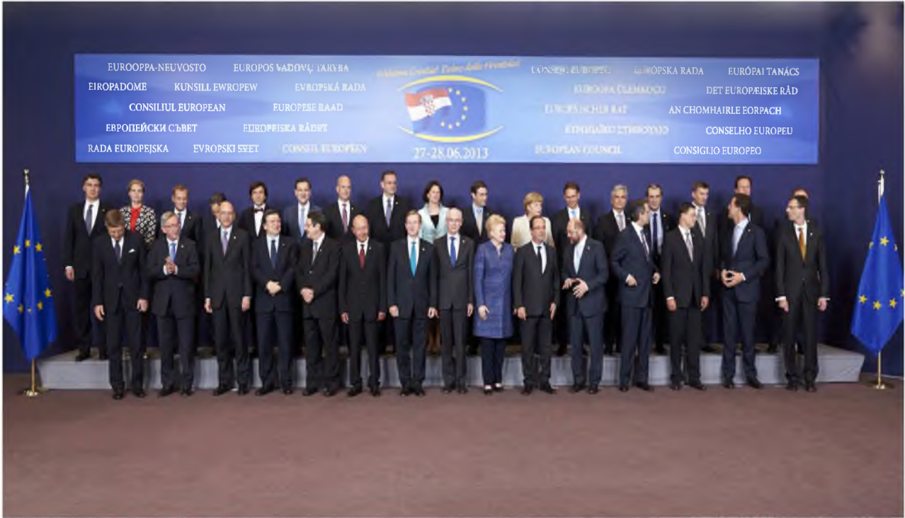
▲ Binnen de Europese Raad - hier ter gelegenheid van de toetreding van Kroatië als lidstaat – bestaan verschillende ideeën over de toekomst van de Europese defensie.

ternationale markt en Europa niet (te veel) afhankelijk wordt van derden voor de ontwikkeling en aankoop van nieuwe generaties defensiematerieel. De Commissie stelt ook voor om meer te investeren in onderzoek dat van belang is voor het GVDB en voor zowel civiele als militaire doeleinden gebruikt kan worden. Als sluitstuk stelt de Commissie voor om capaciteiten te ontwikkelen die zowel voor civiele als militaire doeleinden kun-