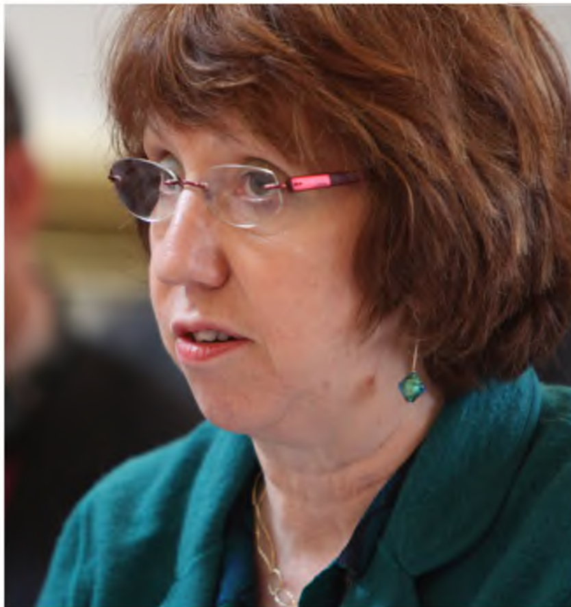
▲ Lady Catherine Ashton heeft leiding over Europese defensie en buitenlandse politiek.

hebben. Over deze regionale focus bestaat meer consensus dan de mondiale rol en dit thema komt dan ook veelvuldig terug in het rapport dat de Hoge Vertegenwoordiger Catherine Ashton opstelde ter voorbereiding op de Europese Raad. 10