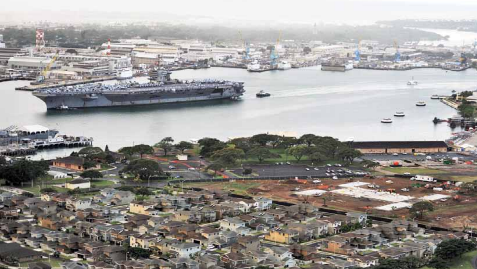
USS Abraham Lincoln (CVN 72) in Pearl Harbor.

De Chinezen benadrukken voortdurend dat zij een 'vreedzame opkomst' nastreven, maar ze verklaren niet waarom ze zo fors investeren in defensie. Velen vragen zich dan ook af hoe China zich als supermogendheid zal gaan gedragen. Zal samenwerking (multilateralisme) of zullen competitie en concurrentie (multipolariteit) domineren?