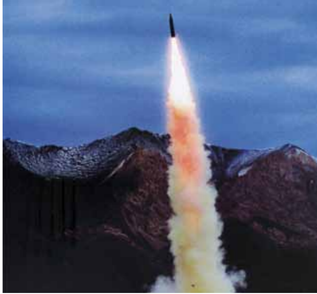
Lancering DF-21 raket

zijn. Hoewel de Amerikaanse krijgsmacht met 1,4 miljoen actief dienende militairen beduidend kleiner is, zijn er wel 700.000 burgers werkzaam bij de Amerikaanse defensie, naast nog eens een groot aantal contractanten. In Irak en Afghanistan samen zijn dat er ongeveer 250.000.