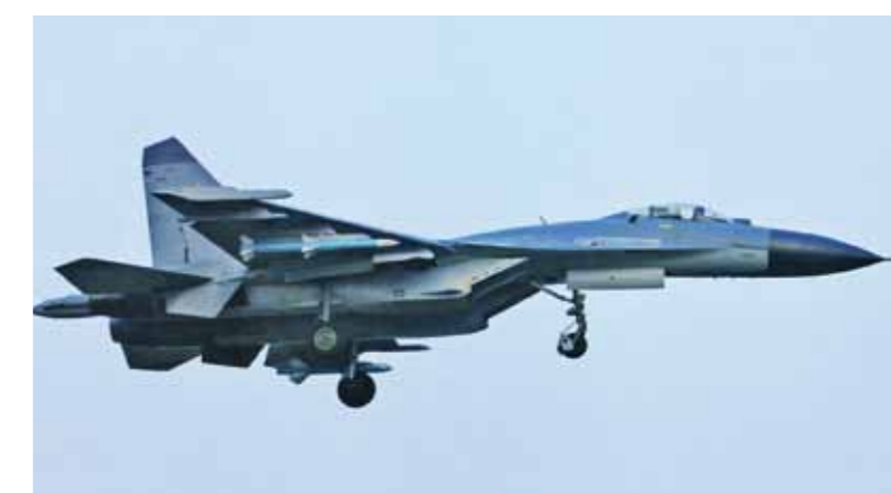
De Chinese J-11, een kopie van de Su-27SK.

Van dit laatste is de recente Arabische lente een treffend voorbeeld.<