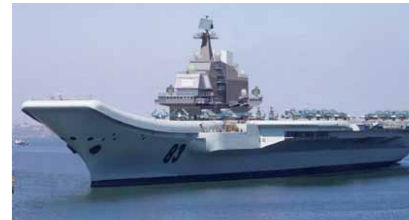
Het voormalige Russische vliegkampschip Varyag wordt omgebouwd tot de Shilang

De prominente rol die Yan de komende twee decennia voor China op economisch en politiek vlak voorziet, steekt echter af tegen de bescheiden rol die het land zich aanmeet op het terrein van de internationale veiligheid. Terwijl de Verenigde Staten zich volgens Yan mengen in conflicten die ze niet kunnen winnen, onthoudt China zich van militaire avonturen.