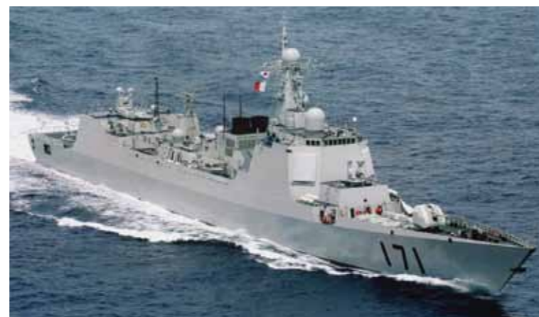
Chinese inzet tegen de piraterij

China beschikt op dit moment niet over vliegkampschepen en geleideraketkruisers en heeft slechts acht geavanceerde geleideraketjagers en vijf nucleaire aanvalsonderzeeboten. China beschikt wel over 59 conventionele onderzeeboten. Vooral de Chinese DF-21 raket, die met een bereik van meer dan 1500 kilometer vanaf land tegen schepen kan worden inge-