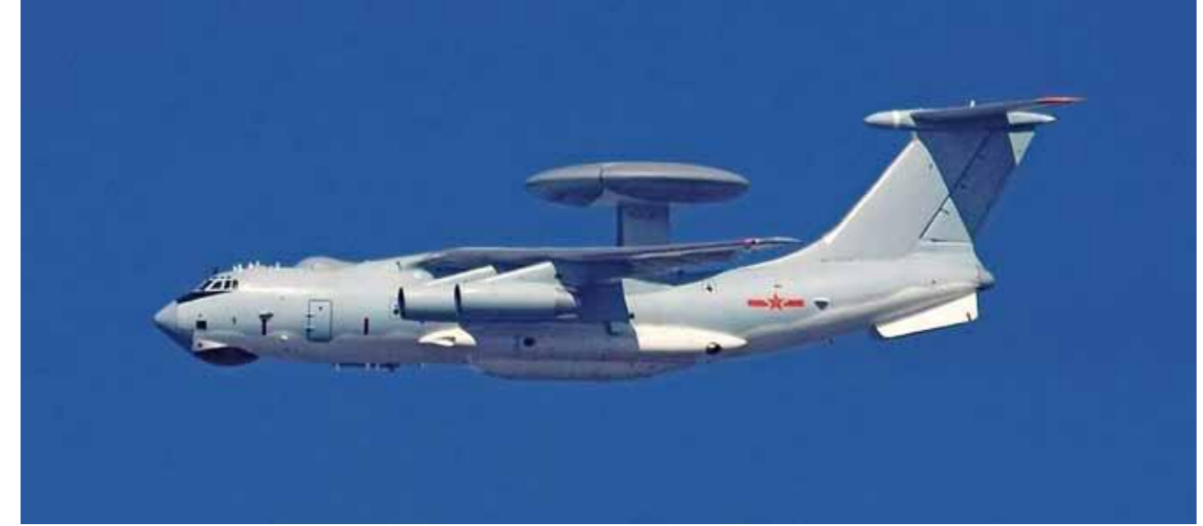
Chinese Awacs Beriev A-501 uitgerust met het Israelische Phalcon AEW-systeem.

zet, baart de Verenigde Staten grote zorgen.